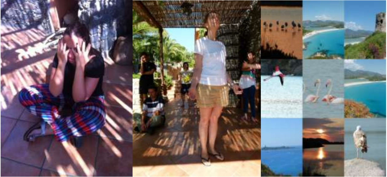
Il nuovo gruppo di volontari quasi al completo!