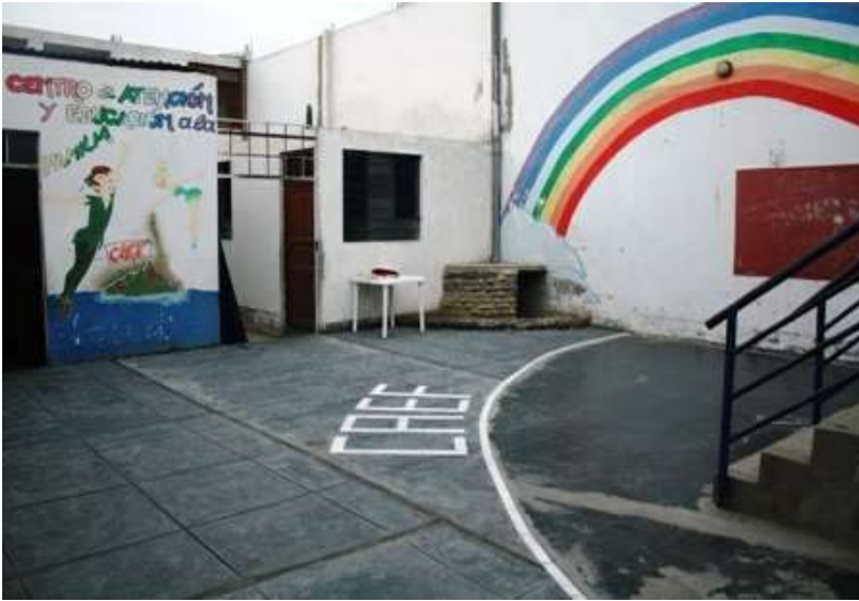
Il patio interno