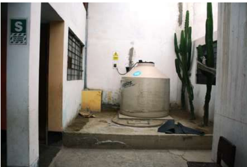
Il nuovo tanke